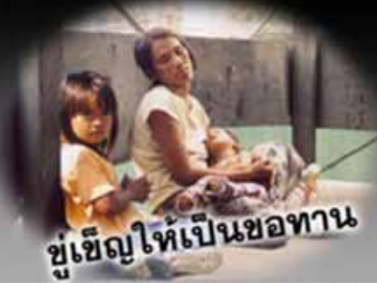
ขู่เชิญให้เป็นขอทาน