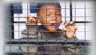
บังคับใช้แรงงาน

พบเห็น เด็ก สตรี ตกเป็นเหยื่อของการค้ามนุษย์